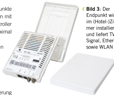
Bild 3: Der Endpunkt wird im (Hotel-)Zimmer installiert und liefert TV-Signale, Ethernet sowie WLAN

Die Bandbreite pro Koaxialkabel beträgt 1,6Gbit/s, wobei sich alle Nutzer eines Kabels diese Bandbreite teilen. Die maximale Upload- und Downlaodrate beträgt jeweils