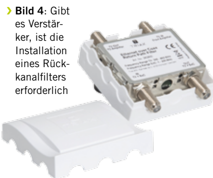
Bild 4: Gibt es Verstärker, ist die Installation eines Rückkanalfilters erforderlich

1Gbit/s. Die Latenzzeit beträgt rund 1ms, womit sich diese Lösung auch für zeitkritische Anwendungen wie Videokonferenzen oder Online-Gaming eignet.